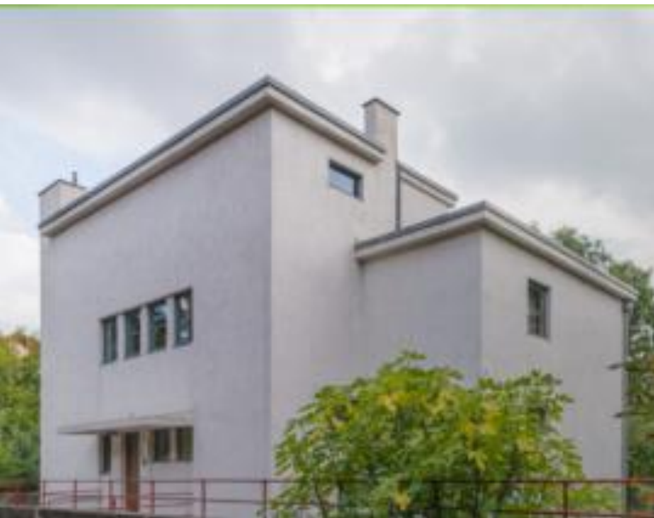
Haus Auerback by Gropius (1929)