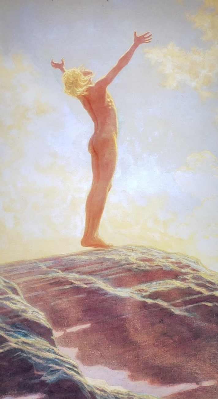
Gebet zum Licht Prayer to the Light