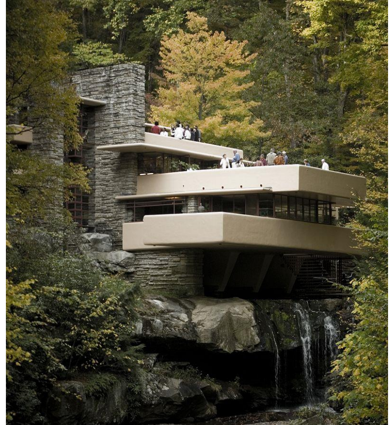
Fallingwater by Frank Lloyd Wright (1937)

Die Bauhausbewegung beeinflusste spätere Künstler und Architekten, allen voran Frank Lloyd Wright, den berühmten amerikanischen Architekten.