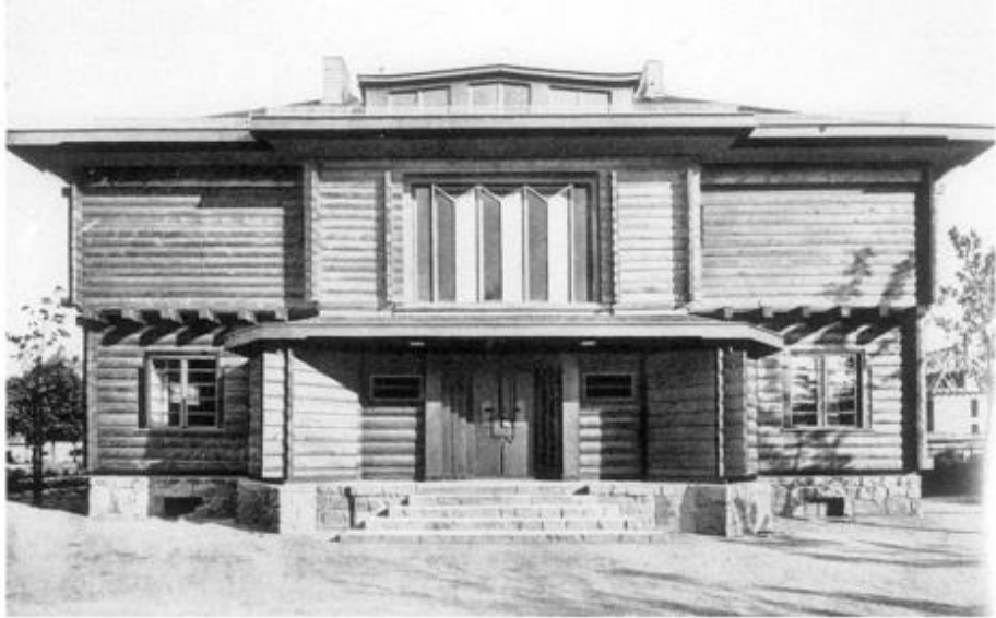
Haus Sommerfeld by Gropius (1925)